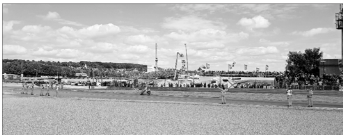
Auf dem Sachsenring fanden im Juli die Motorrad-Weltmeisterschaftsläufe statt. Aufgrund der anhaltenden Trockenheit mussten die Kameraden und Kameradinnen der lokalen Feuerwehren aber nicht nur den Grand Prix absichern, sondern auch zu einem großen Feldbrand nach Gersdorf ausrücken. Glücklicherweise konnte Schlimmeres verhindert werden.