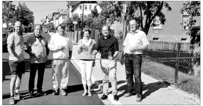
Nach mehrjähriger Bauzeit und der erfolgten grundhaften Sanierung, konnte die Robert-Koch-Straße wieder komplett in Betrieb genommen werden. Erwähnenswert ist zudem, dass auf Grundlage eines Stadtratsbeschlusses seit 2019 keine Straßenausbaubeiträge mehr erhoben werden.