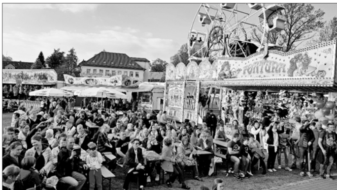
Im Mai fand unser traditionelles Strumpf- und Vereinsfest statt und lockte wieder viele Gäste nach Oberlungwitz. Zudem haben die Oberlungwitzer/innen im Rahmen der Kommunalwahl mit ihren Stimmen die Zusammensetzung des neuen Stadtrates bestimmt.

Wie dem auch sei, im Mittelpunkt der vergangenen Einwohnerversammlung stand nicht das, was uns zukünftig erwartet, sondern der traditionelle bebilderte Jahresrückblick. Wenn man das Jahr dann einmal Revue passieren lässt, ist man immer wieder überrascht, was so alles los war. Anstatt vieler (Groß-)Worte gibt es deshalb diesmal im Folgenden wenigstens einen kleinen bebilderten Jahresrückblick mit einigen Bildern, die neben über 100 anderen Fotos, in der vergangenen Einwohnerversammlung gezeigt wurden: