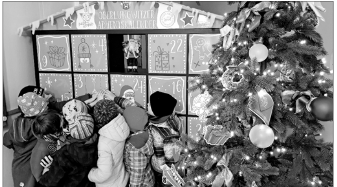
Der „XXL-Adventskalender“ der Stadt Oberlungwitz sorgte während der Adventszeit für strahlende Kinderaugen, denn fast täglich kamen Kinder der städtischen Kindertageseinrichtungen ins Rathaus, um die Geschenke abzuholen.