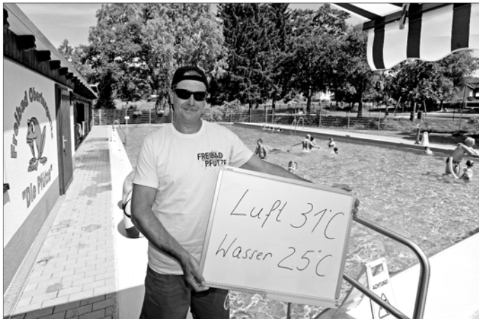
Nach aufwendigen Sanierungsarbeiten wurde das Freibad „Pfütze“ Anfang Juni wieder in Betrieb genommen.