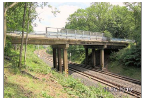
Münnich SB Tiefbau

Geplante Fertigstellung ist Ende Mai 2025.